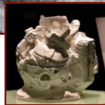
Kaolin künstlerisch interpretiert