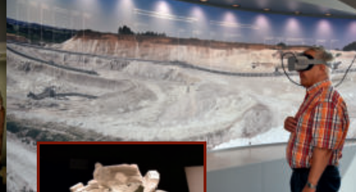
Kaolintagebau im 360-Grad-Blick