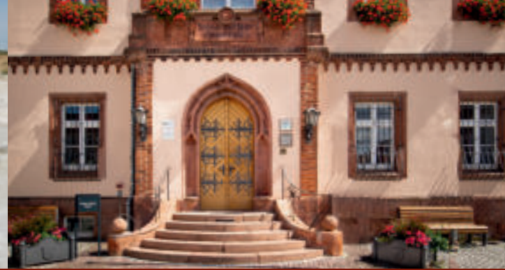
Rathaus Mügeln mit Porphyportal

Von 1883 bis 1974 wurde Kaolin westlich von Mügeln unter Tage abgebaut und über Schächte oder Stollen gefördert. Die Kaolingewinnung mit Hacke und Schaufel war körperlich schwerste Handarbeit. Heute erfolgt der Abbau mit leistungsfähiger Technik in Tagebauen. Etwa 300.000 Tonnen Rohkaolin werden im 2004 aufgeschlossenen Tagebau Schleben / Crellenhain jährlich gefördert. Spezifische Eigenschaften machen die Kemmlitzer Kaoline besonders geeignet für feinkeramische Erzeugnisse. Aufgrund seines Mineralaufbaus zeigt der bei 1400°C gebrannte Kaolin eine rein weiße Brennfarbe.