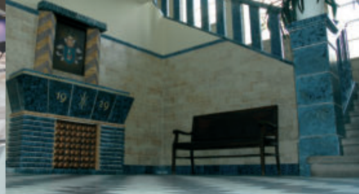
Foyer der Hafnertec.de GmbH