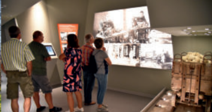
Erlebniswelt Kaolin im Geoportale Bahnhof Mügeln