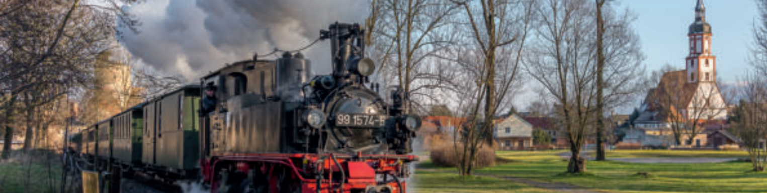
Historisches Stadtzentrum Mügeln mit Schloss Rubetal und Kirche St. Johannes